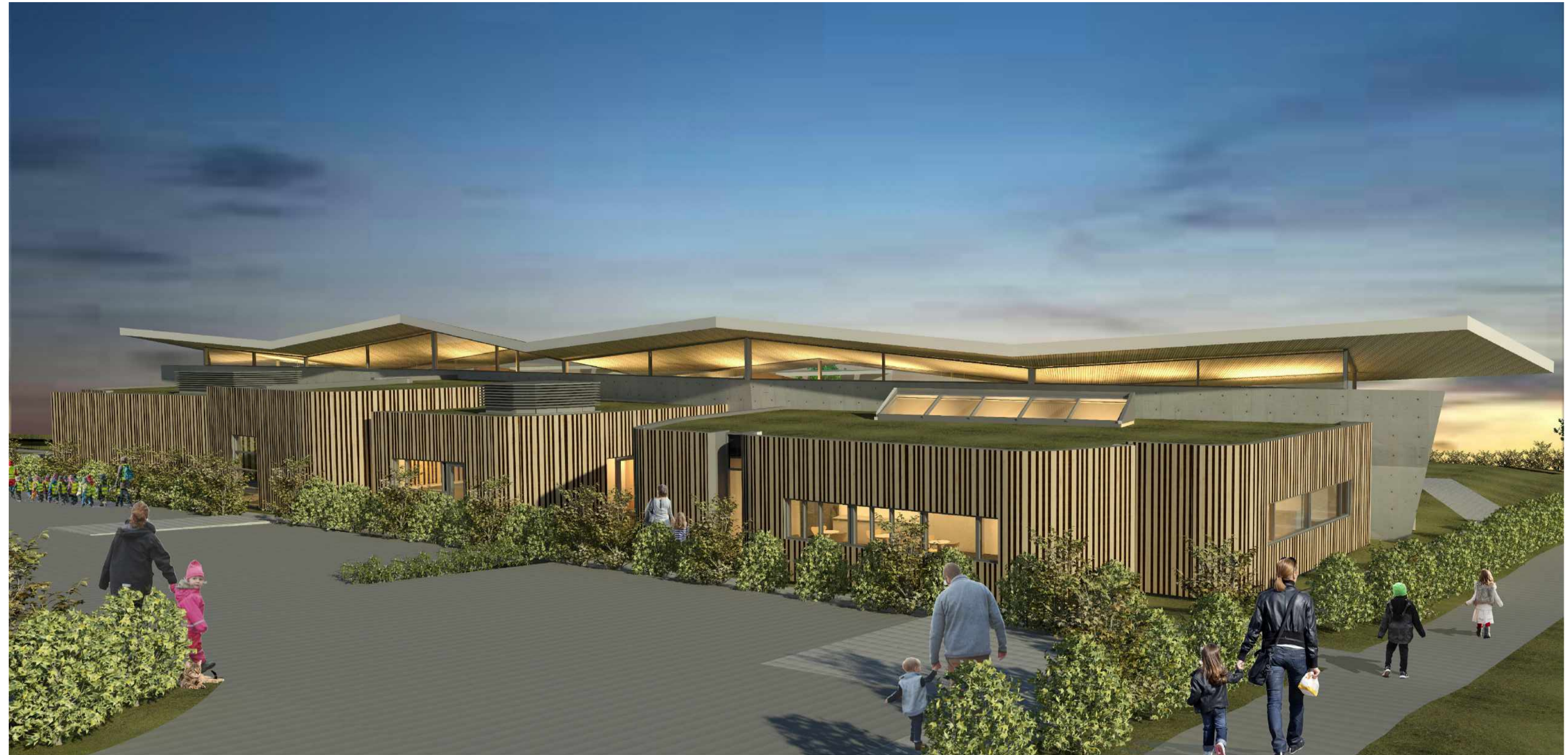
HORFT FRÁ HOLTSVEGI