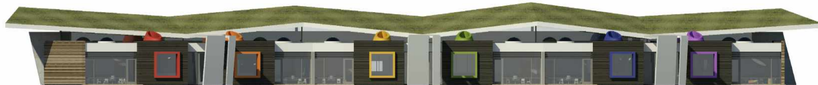
ÚTLIT - VESTUR