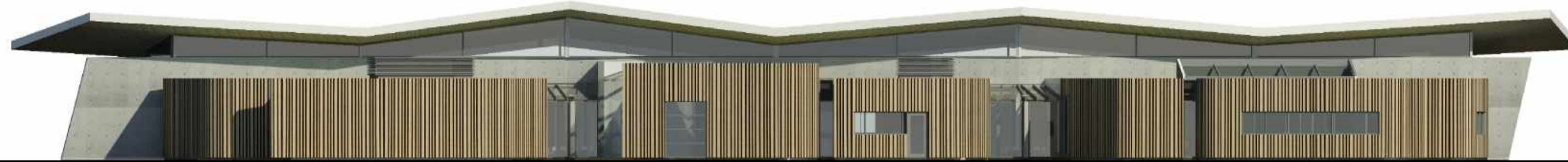
ÚTLIT - AUSTUR