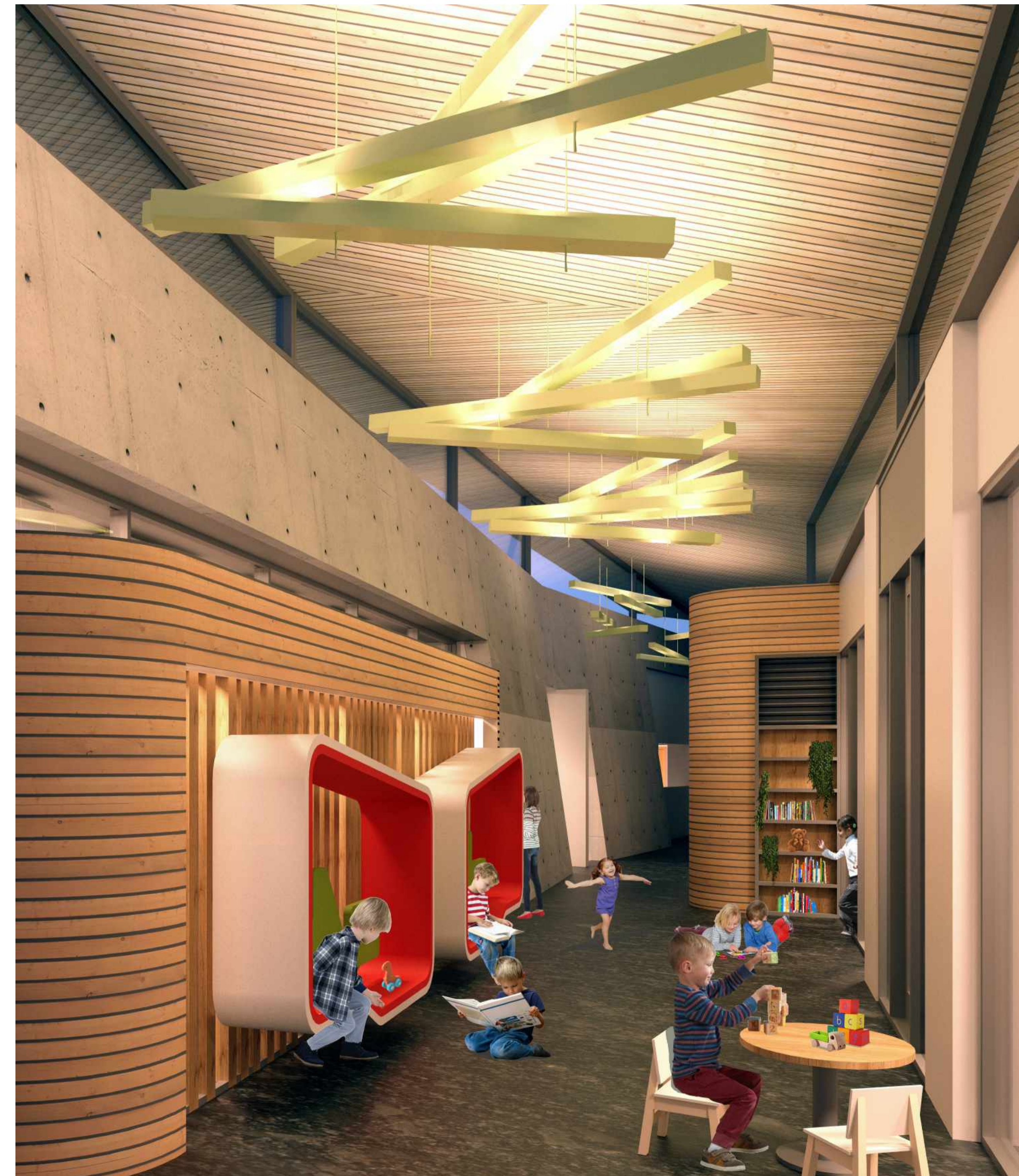
MIÐRÝMI / BÓKASAFN