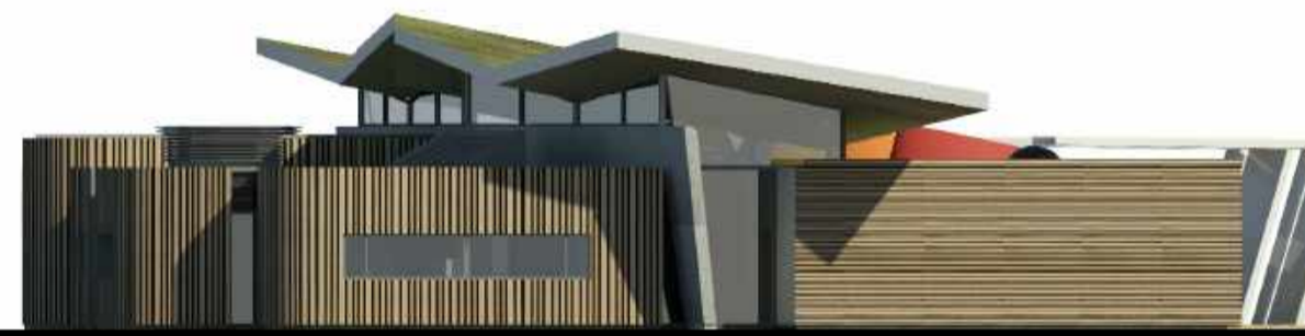
ÚTLIT - NORÐUR