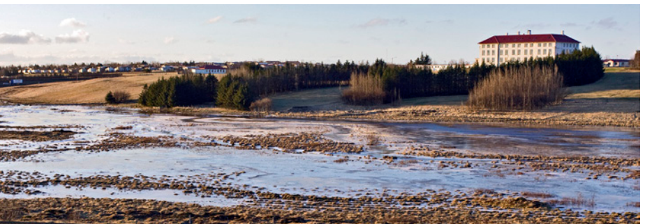
Vatnsmýri við Vífilsstaði

Búrfell og Búrfellshraun með öllum sínum sérheitum s.s. Gálgahraun, Gálgaklettur, Búrfellsgjá og Selgjá.