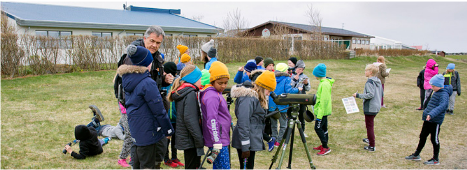
Útikennsla um fugla á Álftanesi