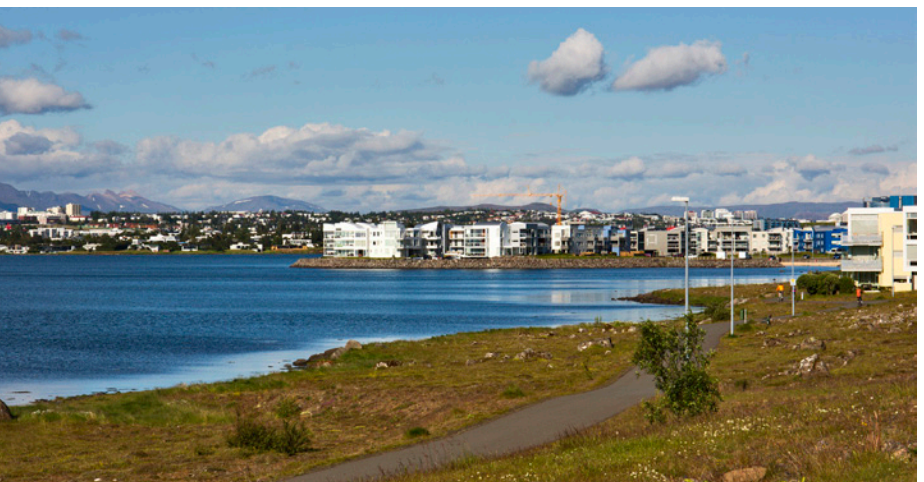
Strandstígur á Sjólandi