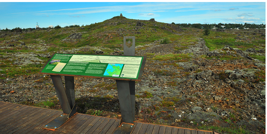
Atvinnubótavegur í Garðahrauni