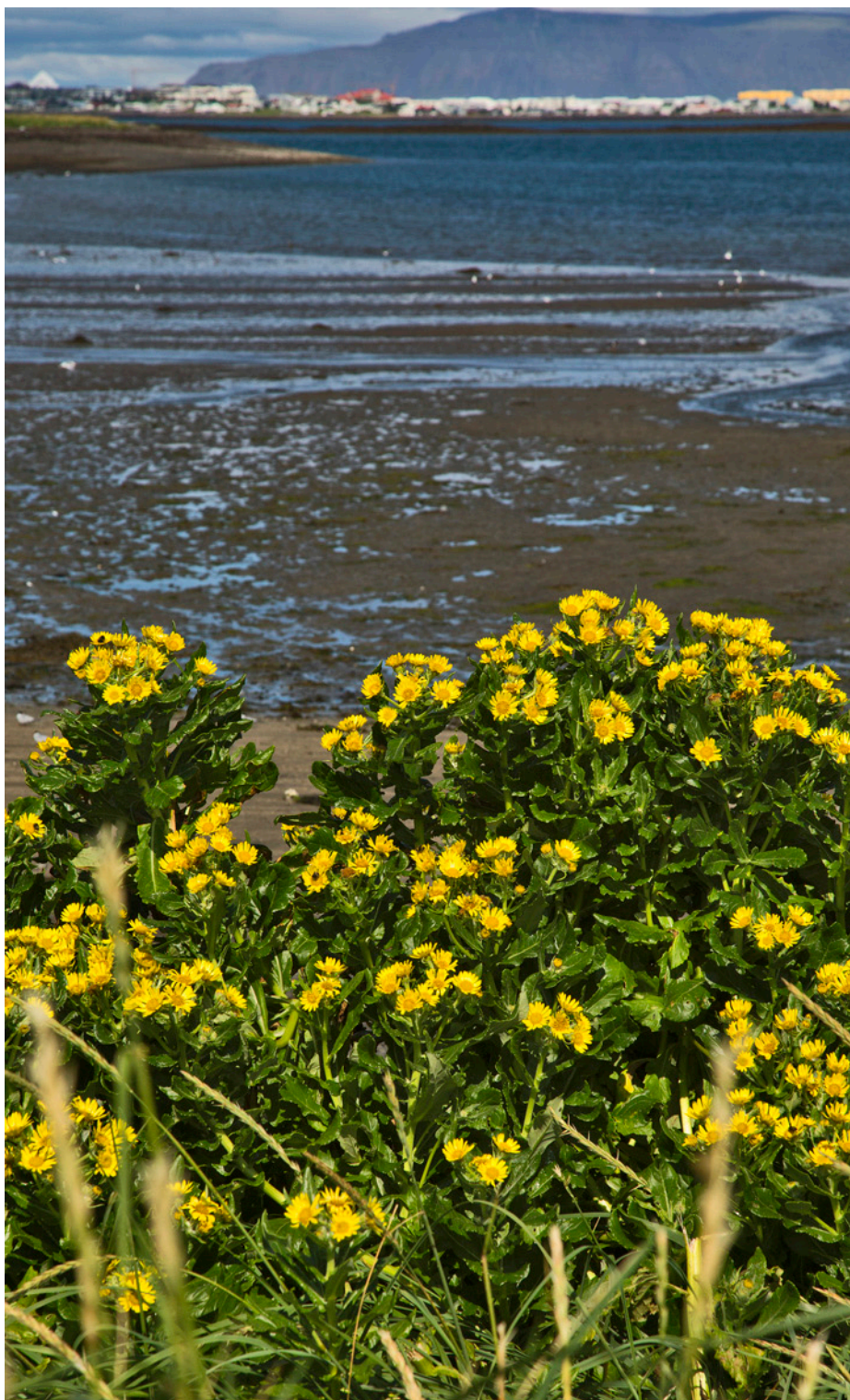
Sjávarleirur í Seylu