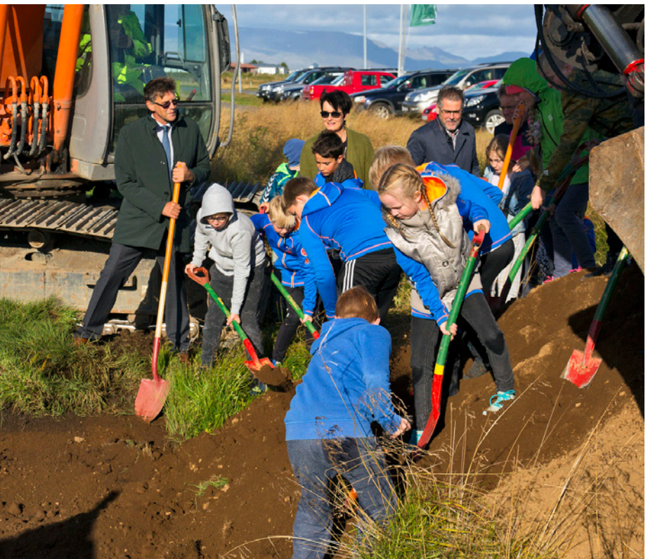
Endurheimt votlendis við Kasthúsatjörn - fyrstu skóflustungur