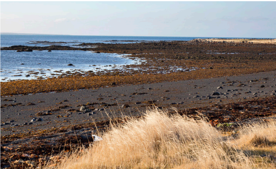
Fjara í Garðahverfi