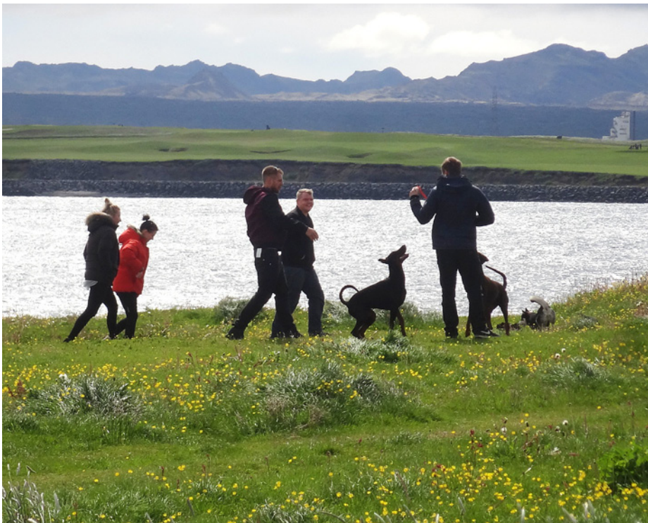
Fólk og hundar í útivist á Bala