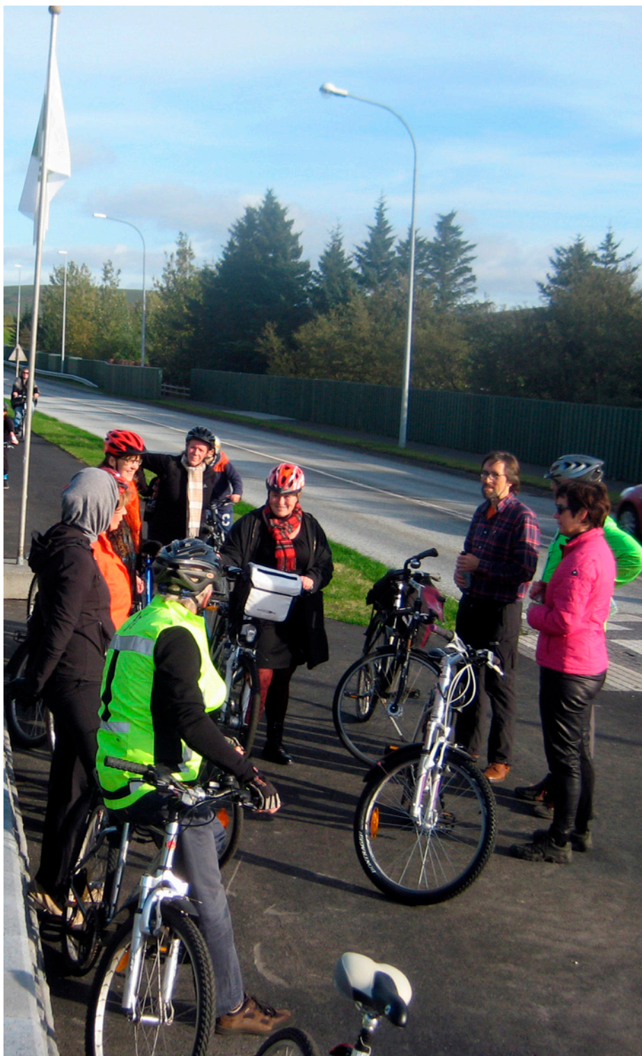
Allir út að hjóla