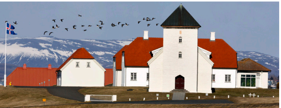
Margæsir yfir Bessastöðum