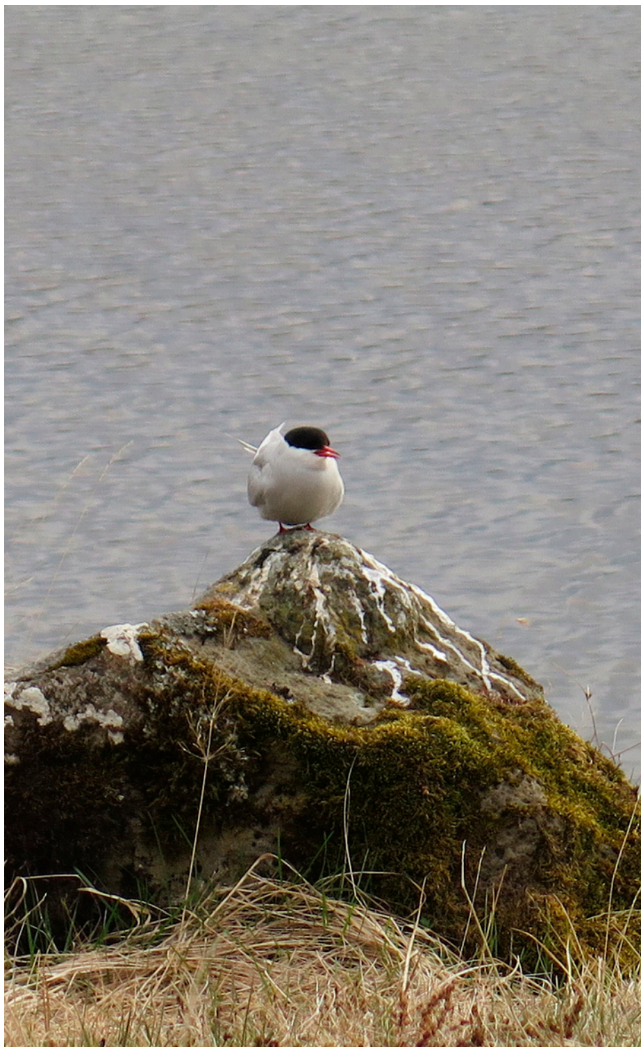
Kría í friðlandi Vífilsstaðavatns