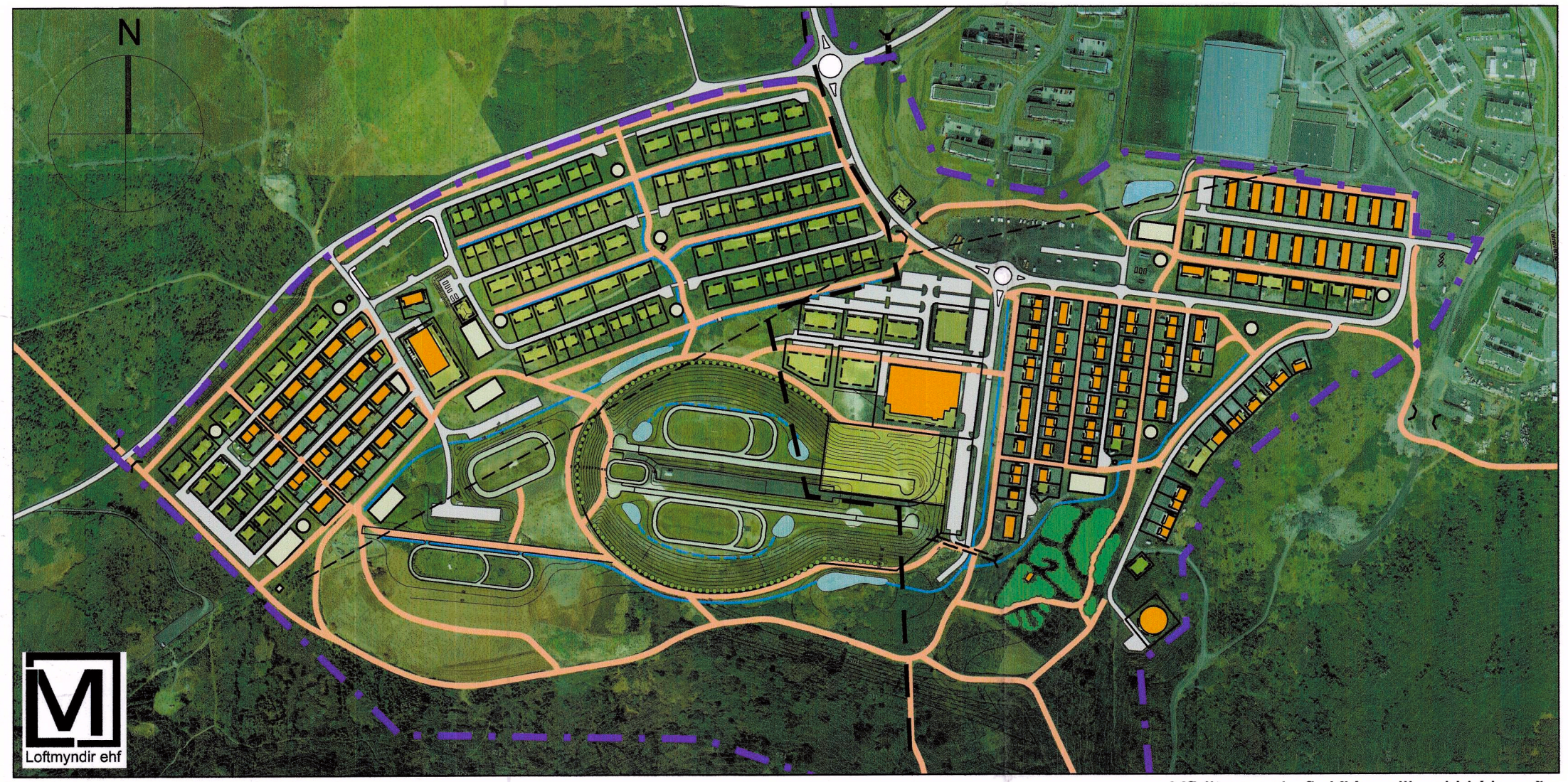
Yfirlitsmynd yfir Kjóavelli, ekki í kvarða