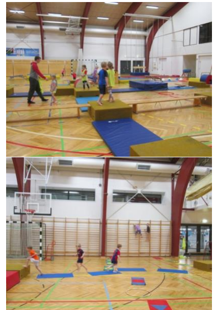
Prautabraut í sal Álftanesskóla