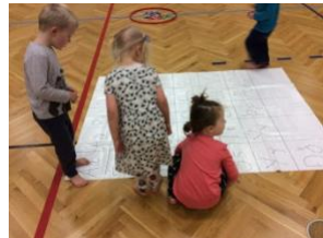
Unnið með bókstafi