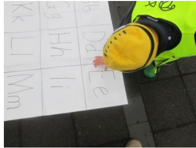
Útiverkefni - Tappar með bókstöfum

Í október og nóvember 2015 hittust leikskólastjóri, verkefnastjóri Holtakots og einn fulltrúi frá hverri deild 1x í viku og fóru yfir markmið og skipulagningu. Þessir fundir voru mjög góðir og