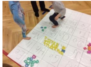
Finna réttan staf á dúk