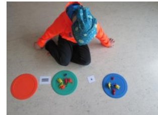
Samlagning og fundið viðeigandi tölustaf