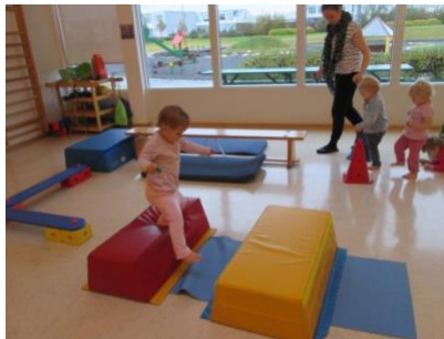
Börnin fara með dýrin í gegnum brautina