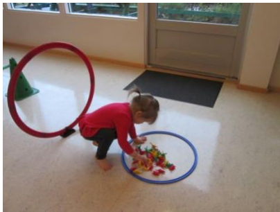
2 ára börn í þrautabraut og ná í dýr í fyrirfram gefnum litum