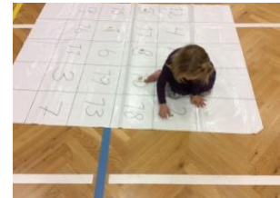
Finna réttan tölustaf á dúk