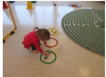
Í lokin flokka þau dýrin eftir lit

Elstu tveir árgangarnir kynntust Leikur að læra veturinn 2014-2015. Þá var börnunum skipt niður í minni hópa og fóru í salinn 1x í viku. Það var farið í skipulagða hreyfingu í bland við Leikur að læra.