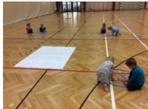
Leikur að læra í sal Álfтанesskóla

Í apríl og maí er hugmyndin að vera með Leikur að læra í útiveru.