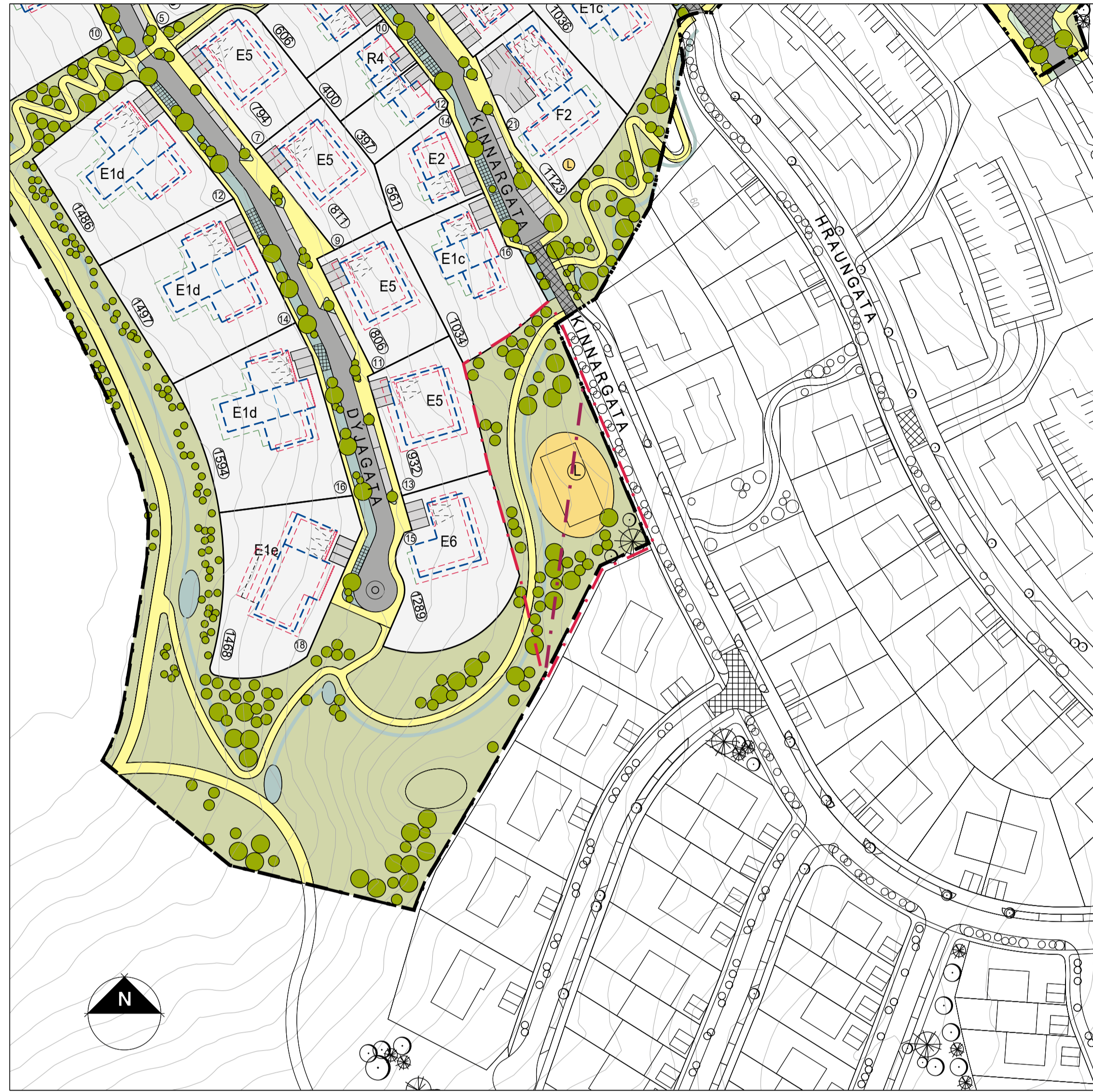
Tillaga að breytingu á deiliskipulagi