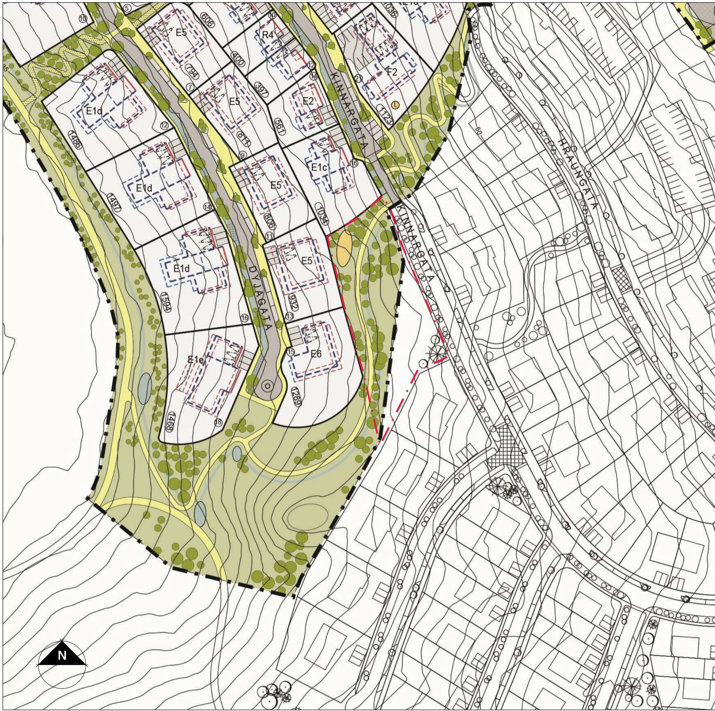
Gildandi deiliskipulag vesturhluta Urríðaholts samþykkt í bæjarstjórn 16.08.2007 með síðari breytingum