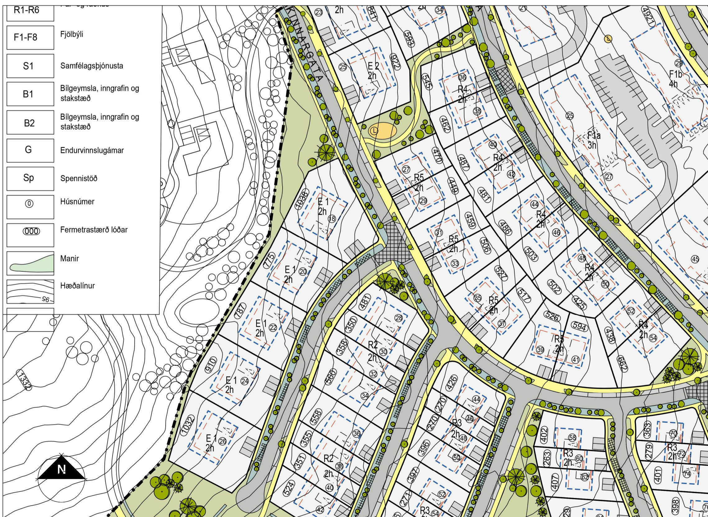
Skýringar mynd Gildandi deiliskipulag austurhluta Urríðaholts samþykkt í bæjarstjórn 06.09.2018 með síðari breytingum