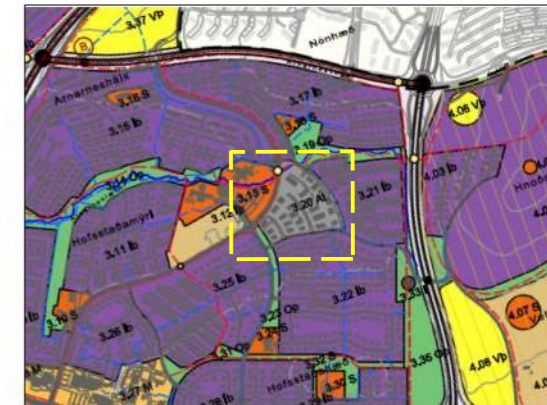
Hluti af Aðalskipulagi Garðabæjar 2016-2030