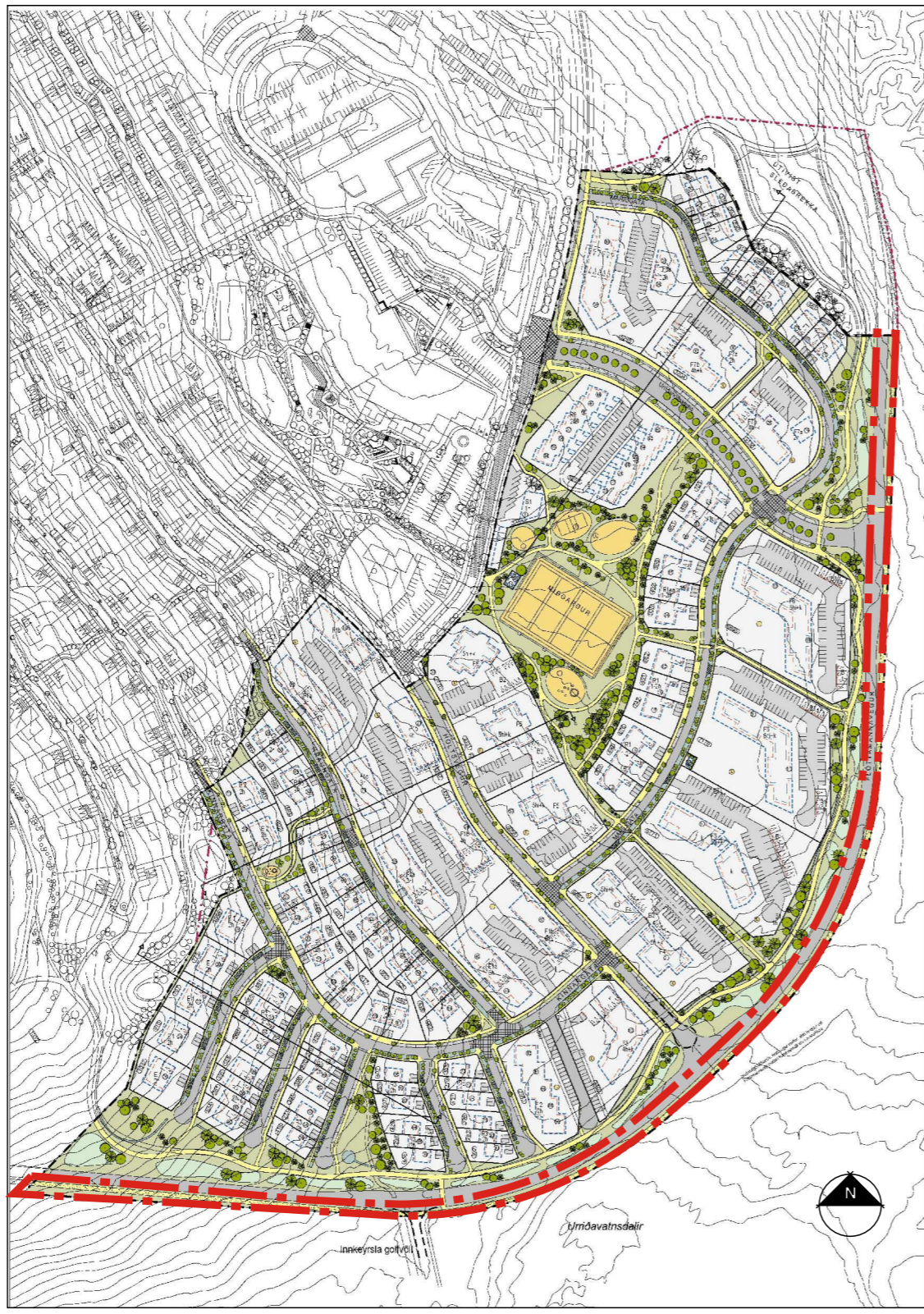
Gildandi deiliskipulag Urríðaholt austurhluta 1. áfangi samþykkt í bæjarstjórn 06.09.2018 mkv:1:4000