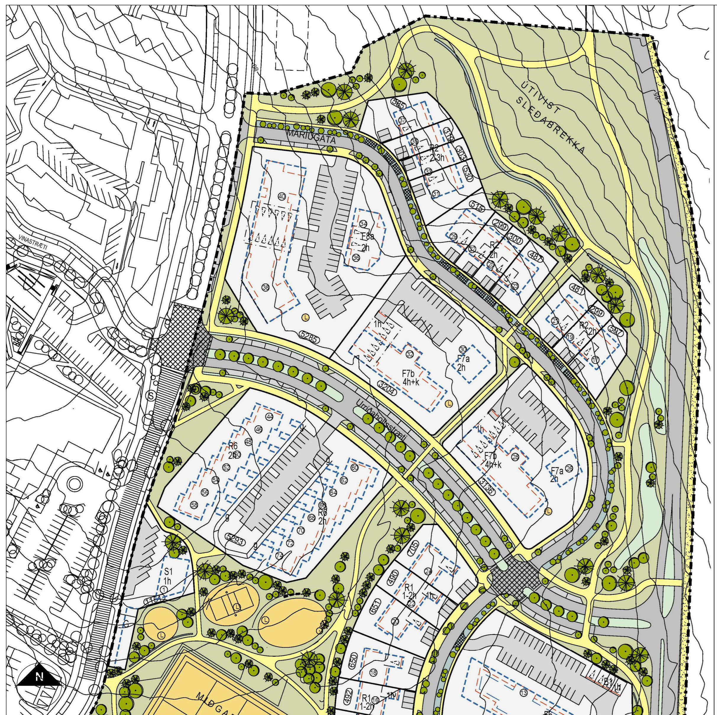
Gildandi deiliskipulag samþykkt í bæjarstjórn 06.09.2018 mkv. 1:1000