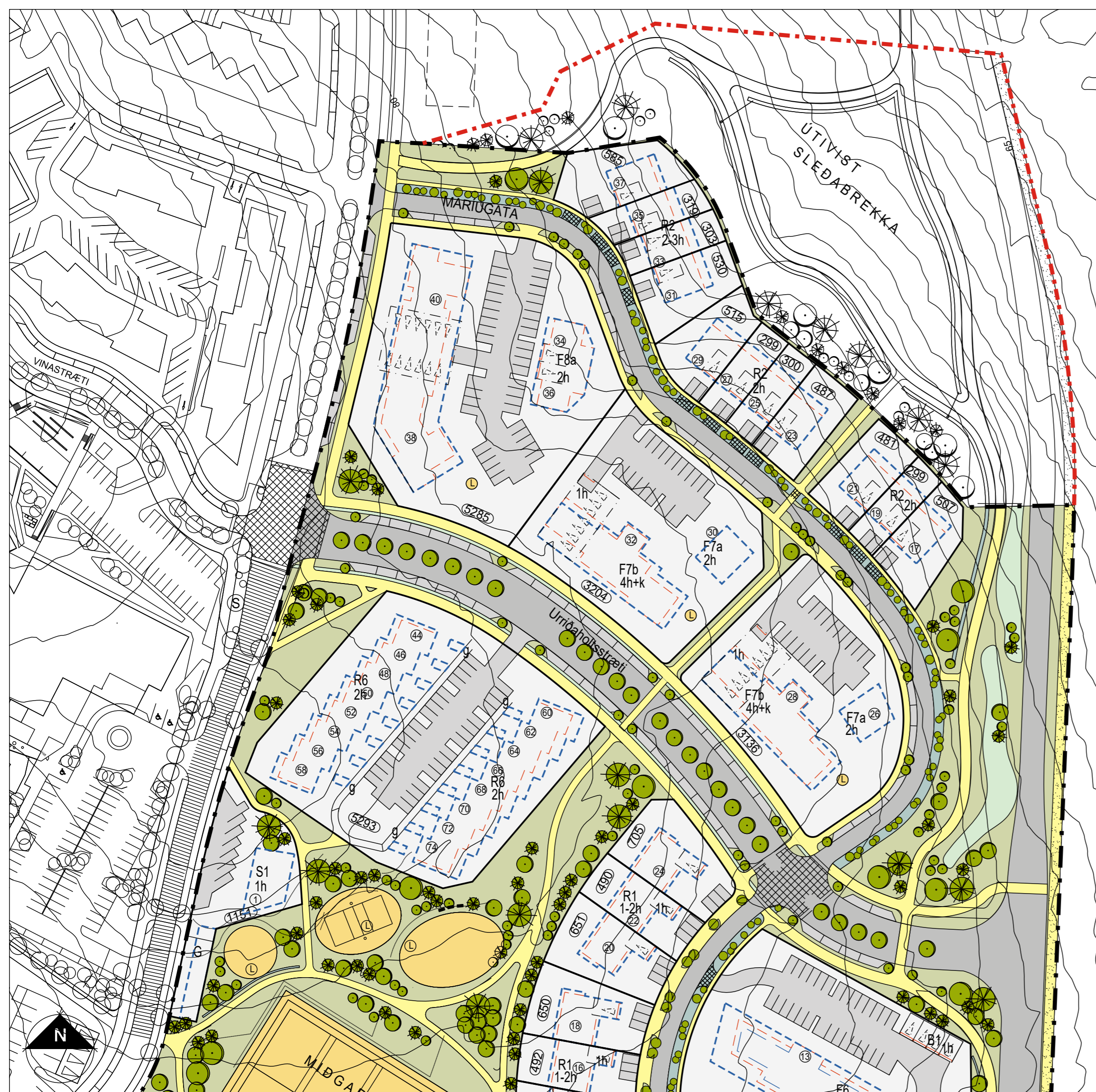
Tillaga að breytingu á deiliskipulagi - breytt afmörkun svæðis mkv. 1:1000

Á lóðum þeirra húsa, þar sem fjarlægð frá einbýli, tvíbýli og raðhúsum að lóðarmörkum er minni en 6 m, er heimilt að skilgreina dvalarsvæði sem nær 3 m út frá húsvegg. Dvalarsvæði og skjólveggir vegna þeirra skulu koma fram á aðaluppdráttum.