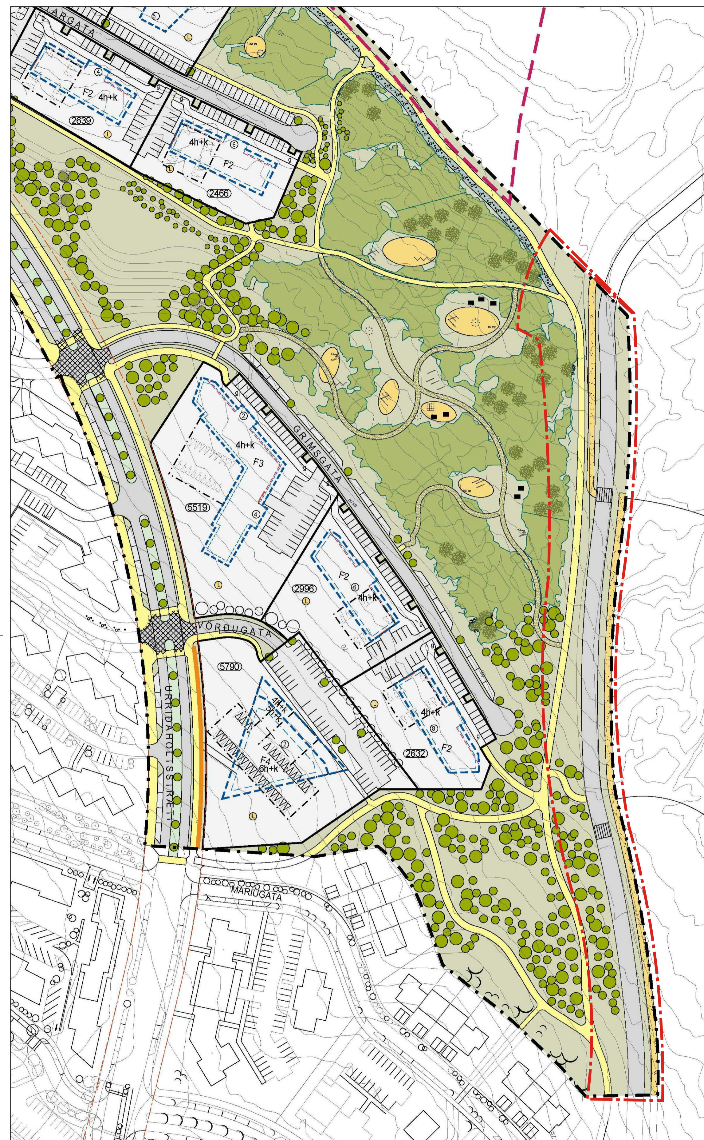
Gildandi deiliskipulag samþykkt í bæjarstjórn 18.03.2021 með síðari breytingum mkv. 1:1000