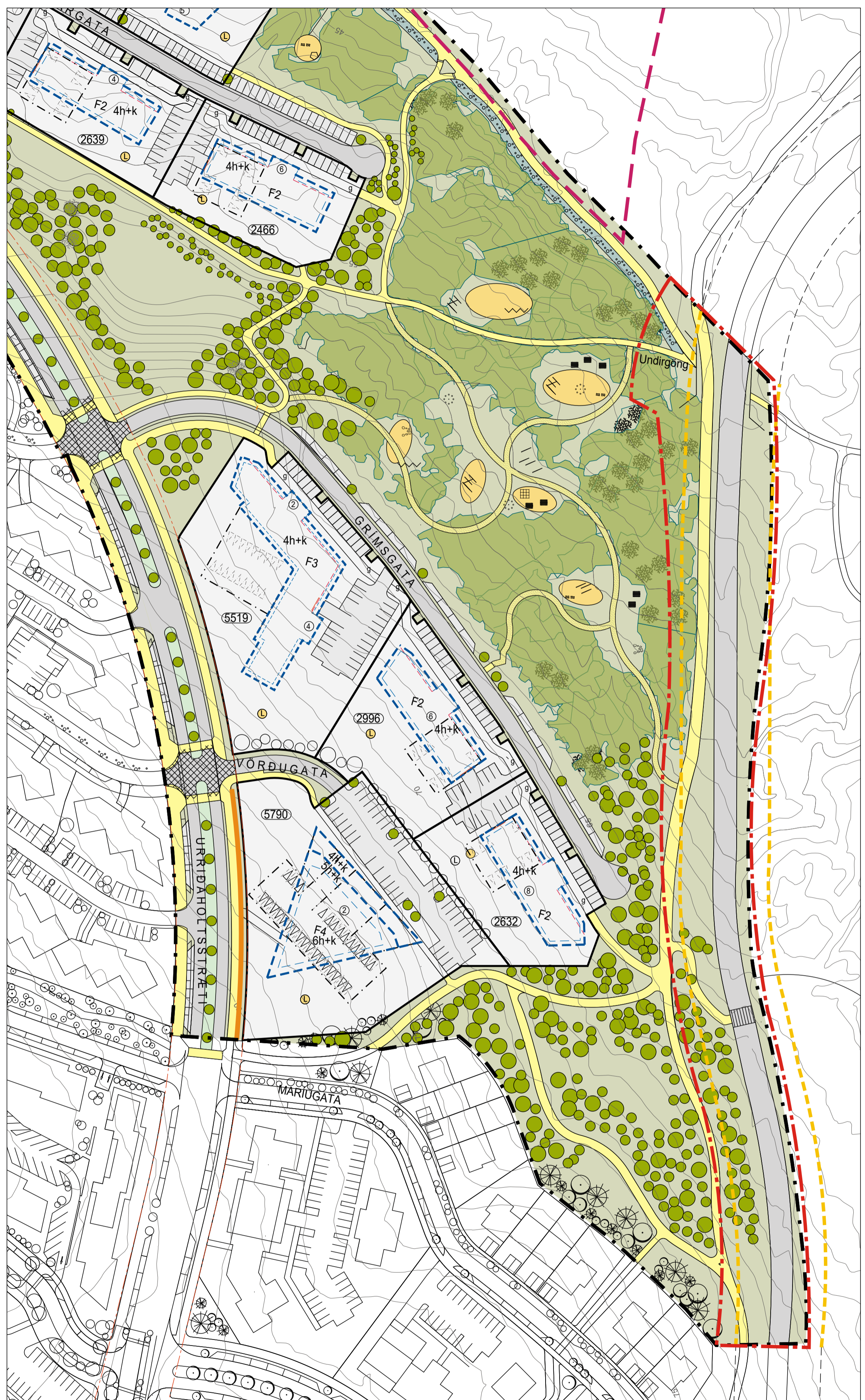
Tillaga að breytingu á deiliskipulagi mkv.1:1000

Greinargerð Vegna deiliskipulagsbreytinga á norðurluta 4. áfanga vegna reiðleiðar og undirganga við Flóttamannaveg: Í deiliskipulagsbreytingunni felst að: Reiðleið meðfram Flóttamannavegi er felld niður Undirgöngum er komið fyrir undir Flóttamannaveg sem tengja norðurluta 4. áfanga við útivistarsvæði austan Flóttamannavegs.