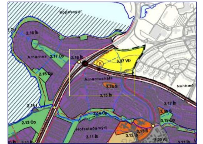
Hluti af Aðalskipulagi Garðabæjar 2016-2030

Að öðru leyti gilda útgefnir skilmálar, sem gerðir voru af Teiknistofu Ingimundar Sveinssonar og samþykktir í bæjarstjórn Garðabæjar þ. 2. mars 2006.