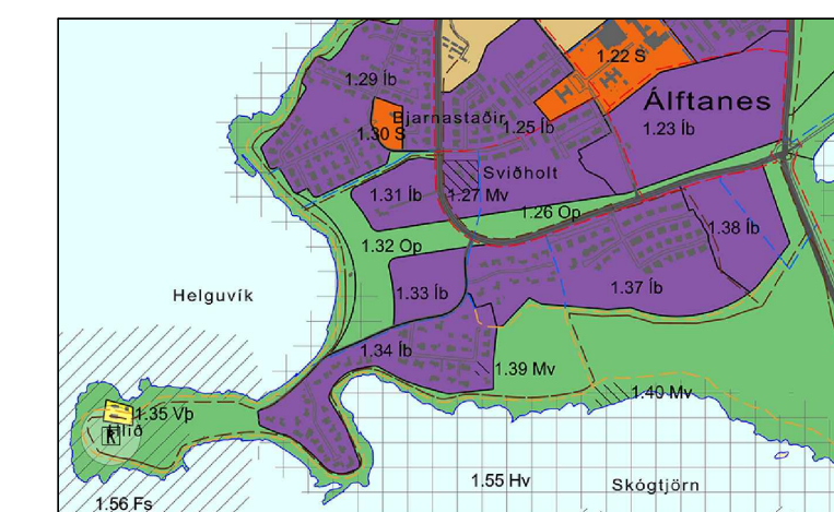
Deiliskipulag Garðabæjar 2016-2030

Hluti af deiliskipulagi þessu er deiliskipulagsgreinargerð dags. 04.04.2019 Teikning 105 Svæði 5 - Skógtjörn