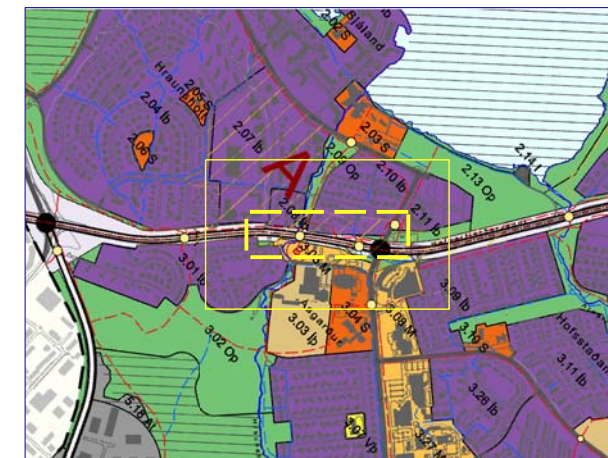
Hluti af Aðalskipulagi Garðabæjar 2016-2030