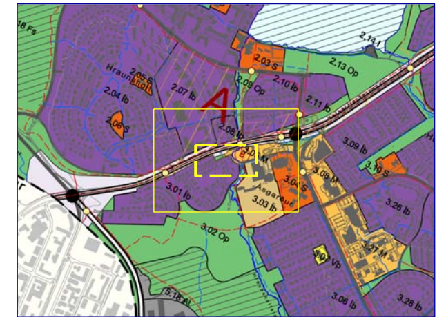
Hluti af Aðalskipulagi Garðabæjar 2016-2030