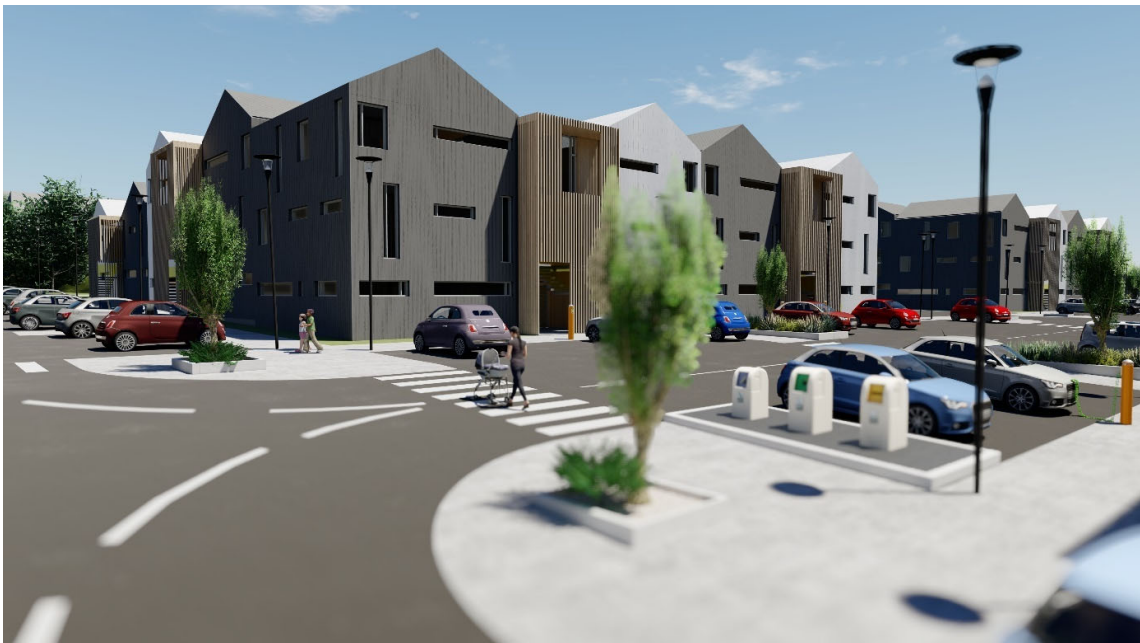
Mynd 4. Djúpgámar og rafhleðslustöðvar við götu.

Meginhugmynd deiliskipulagsins er að byggingar umlykja inngarða sem eru ýmist opnir að hluta eða alveg lokaðir en hafa þá opinn aðgang a.m.k. frá tveimur hliðum. Þannig skapast skjólsæl rými örugg fyrir yngstu íbúana og í næði frá bílum og umferð, með dvalar- og leiksvæðum. Í samræmi við rammaskipulagið, tengir græn gönguleið umhverfi Hraunsholtslækjar við nýjan leikskóla við Lyngás og áfram að leikskólanum Ásum við Bergás og græna geirann að baki hans. Stígurinn er í senn göngu- og hjólaleið auk þess sem hægt verður að bjóða upp á útivistartengd leik- og æfingarsvæði meðfram stígnum. Þar sem stígurinn þverar götur fær hann forgang bæði sem umferðarleið og í efnisvali.