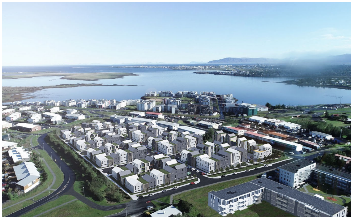
Mynd 7. Skipulagssvæðið úr suðaustri

Íbúðir á jarðhæð skulu hafa sérafnotarétt af lóð. Ef engin íbúð er á jarðhæð telst svæðið næst húsvegg vera sameign. Stærð þessa reita skal vera að minnsta kosti svalastærð efri hæða en mega að hámarki ná 4 metra frá útvegg húsa. Sérnotafletir skulu að lágmarki hafa 20% gróðurþekju.