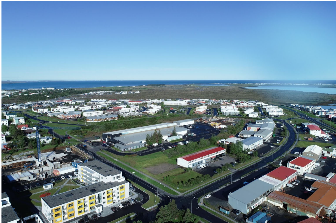
Mynd 2. Núverandi ásjúnd skipulagsvæðis.

Markmið deiliskipulagsins er að skapa hagkvæmar íbúðir sem ætlað er að höfða sérstaklega til yngra fólks. Meðal leiða til að ná þessu markmiði verða m.a. sameignarrými í lokunarflokki A skv. skráningartöflu, í algjöru lágmarki og engir bílakjallarar verða í byggingum við Eskiás, heldur verða húsagötur nýttar til að þjóna stæðum sem liggja 90 gráður á legu gatna. Bílastæði eru 1,25 stæði á íbúð. Á þessu svæði verða engir kjallarar. Nýjar byggingar við Lyngás verða með bílakjöllum.