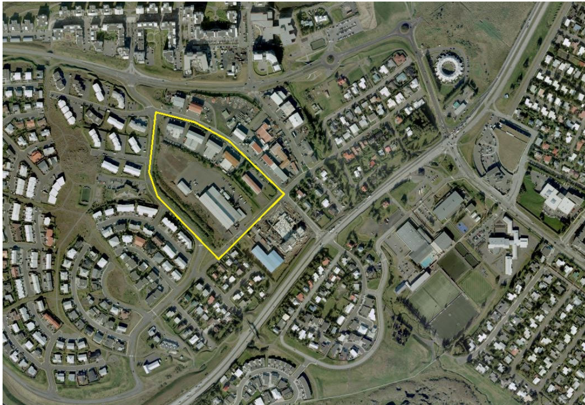
Mynd 1. Afmörkun skipulagssvæðisins.

Svæðið er miðlægt innan Garðabæjar og í nálægð við verslun og þjónustu. Stutt er í útivistarsvæði við Arnarnesvog, bæjargarð við Hraunsholtslæk og íþróttasvæði við Ásgarð. Deiliskipulagssvæðið er að mestu leyti athafnasvæði, ýmist malbikað, malarborið eða grassvæði með lágum trjágróðri þar sem fyrir eru iðnaðar- og skrifstofubyggingar.