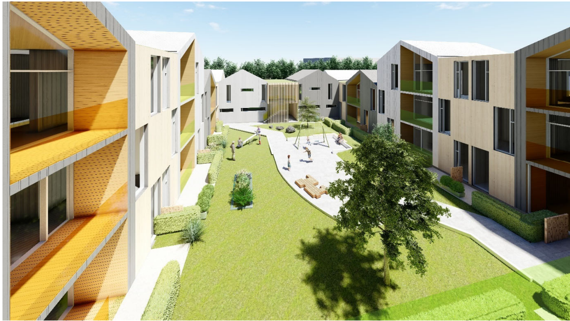
Mynd 6. Inngarður