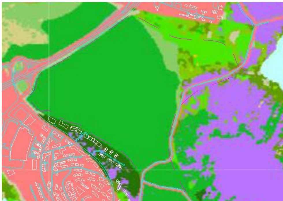
Mynd 6 Vistgerðarkort Náttúrufræðistofnun Íslands sett undir grunnkort deiliskipulagsins, ekki hnitsett. Dökk brotalína eru skipulagsmörk.

Verndargildi grasmóavistar, snarrótarvistar er metið hátt og lyngmóavistar miðlungi hátt. Allar þrjár eru á lista Bernarsamningsins.