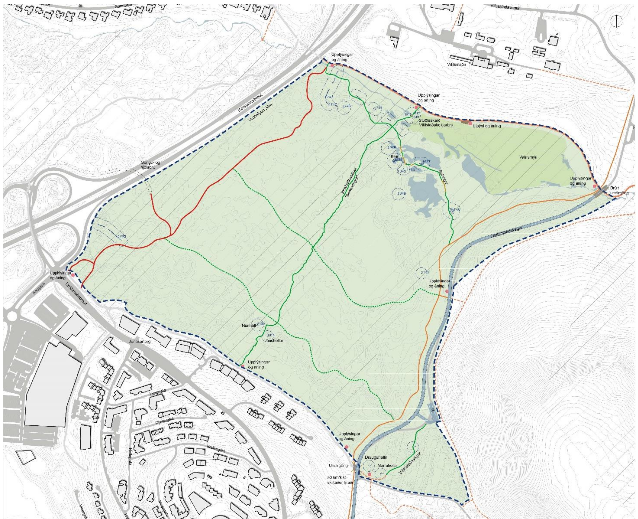
Mynd 1 Afmörkun deiliskipulagsins.

skal náttúrulega gróðurþekju hraunsins, mosa og lynggróður og er óheimilt að rækta í því landi án leyfis bæjaryfirvalda. Einnig kemur fram í aðalskipulaginu að þar vex barrviður sem gróðursettur var frá 1950-1952 en sá hluti er utan við þetta deiliskipulag.