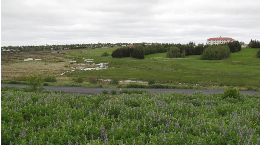
Mynd 4 Vatnsmýrin 17. júní 2013. Tekin við Flóttamannaveg.