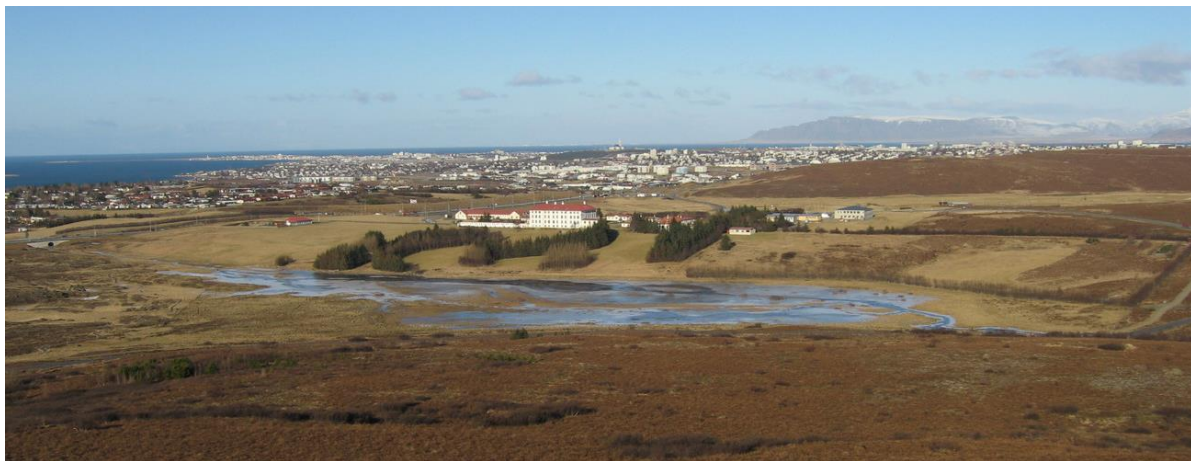
Mynd 5 Vatnsmýrin 25. febrúar 2007. Tekin frá Hlíðarhorni. Hér kemur vel fram að um flæðimýri er að ræða.