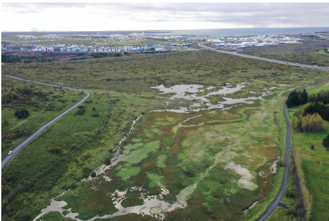
Mynd 3 Vatnsmýrin 24. september 2021 eftir talsverða úrkomu.

Í skýrslu frá 2017 2 vegna fuglatalningar, meðal annars á Vatnsmýrinni, kemur fram að Vatnsmýrin er flæðimýri, um 5 ha að stærð. Mýrin er forblaut á vorin, í apríl og maí, en þegar líður á sumarið þornar hún yfirleitt mikið. Þetta er lítið en gróskumikið votlendi sem var ofbeitt af hrossum á árum áður. Í friðlýsingunni kemur fram að þar vex gróskumikil mýrastör og gulstör ásamt engjarós og horblöðku. Votlendið í Vatnsmýri telst fágætt á svæðisvísu. Breytileiki Vatnsmýrarinnar er mikill eins og sést á eftirfarandi myndum en tekið skal fram að sjónarhornið getur haft mikil áhrif.