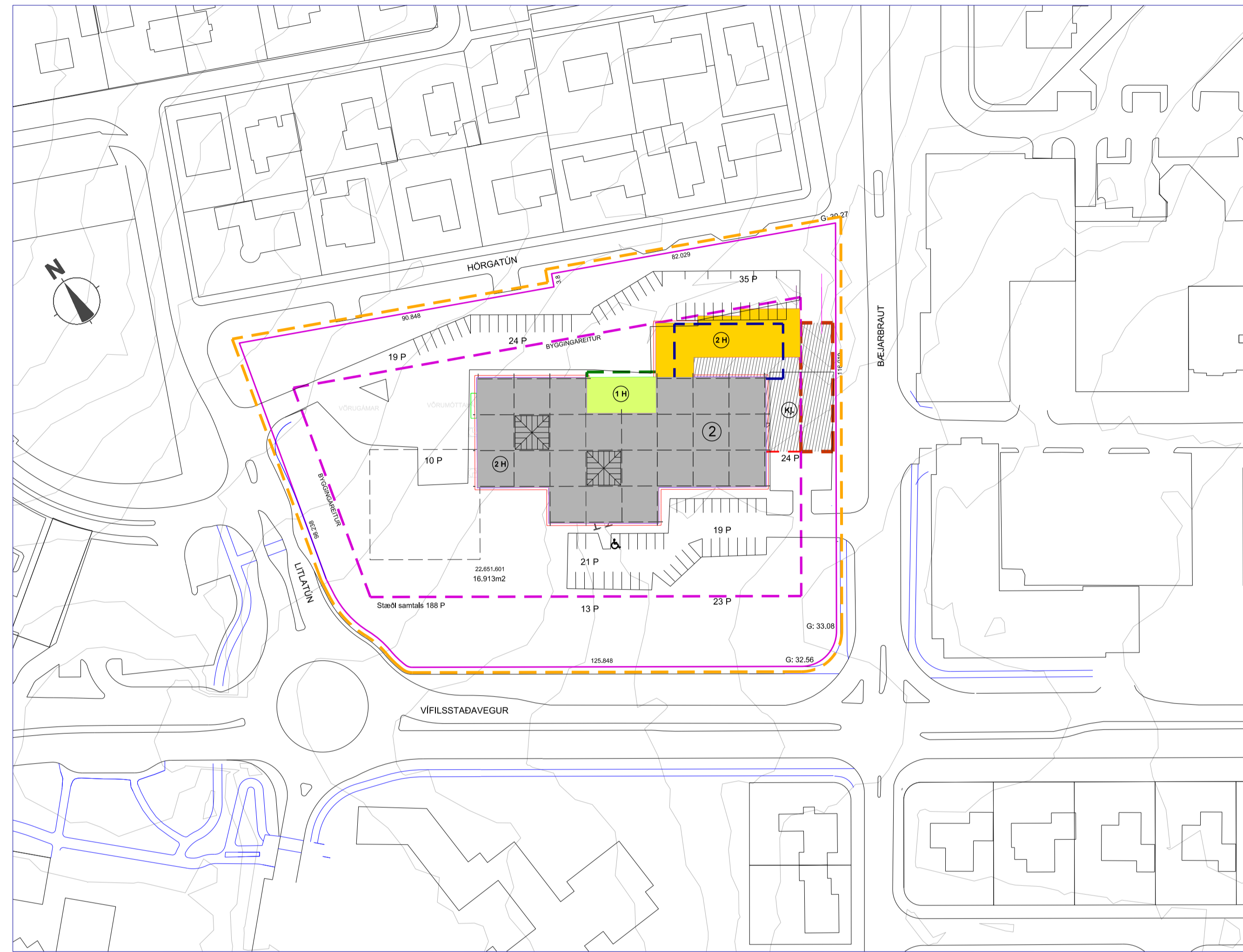
Eftir breytingu 1:1000

Auglýsing um gildistöku breytingarinnar var birt í B-deild Stjórnartíðinda þann _____ 2018.