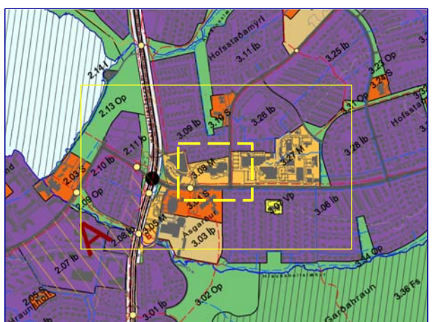
Hluti af Aðalskipulagi Garðabæjar 2004-2016

Deiliskipulag fyrir Miðbæ Garðabæjar - Neðsta svæði (Svæði III) var samþykkt í bæjarstjórn Garðabæjar 7. júní 2007. Breyting á deiliskipulaginu var samþykkt í bæjarstjórn Garðabæjar 15. okt. 2009.