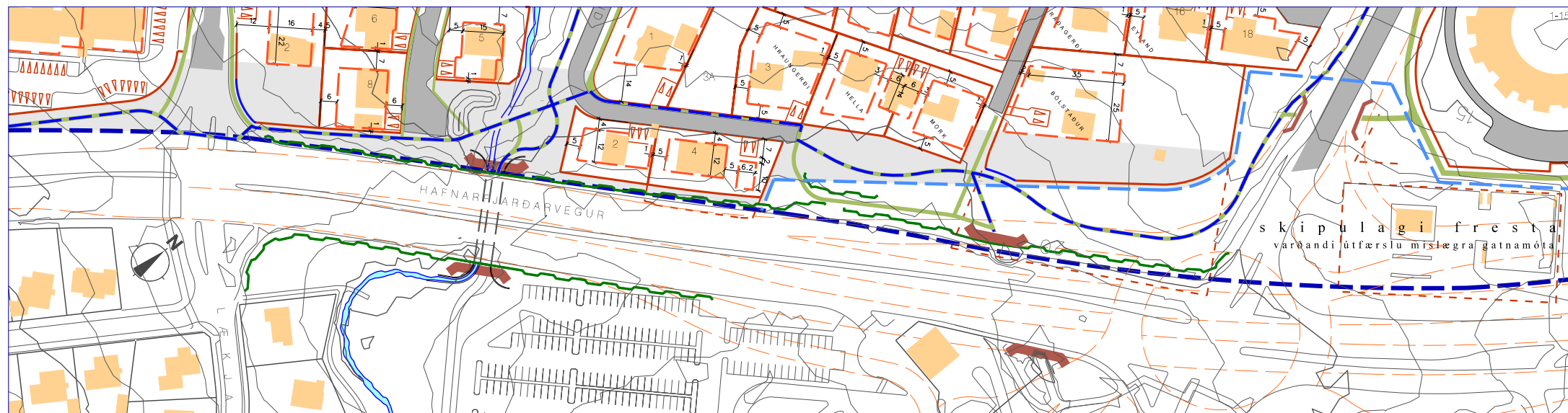
Eftir breytingu 1:2000