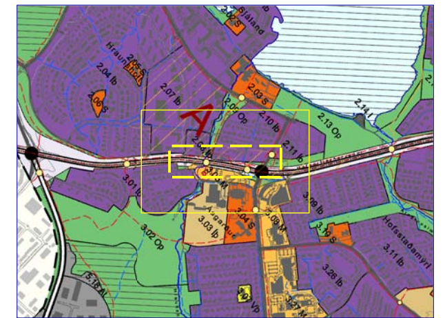
Hluti af Aðalskipulagi Garðabæjar 2016-2030