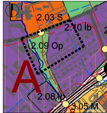
GILDANDI AÐALSKIPULAG, STAÐFEST 6. APRÍL 2018 Mkv. 1:10.000