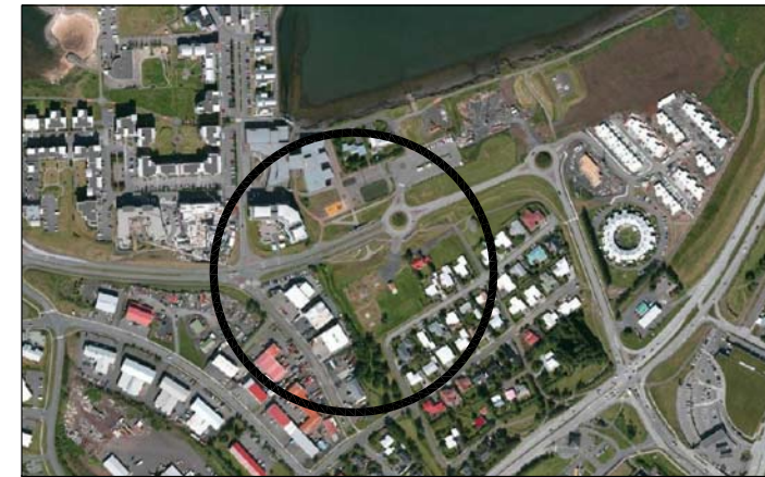
Loftmynd af svæðinu 1:10.000