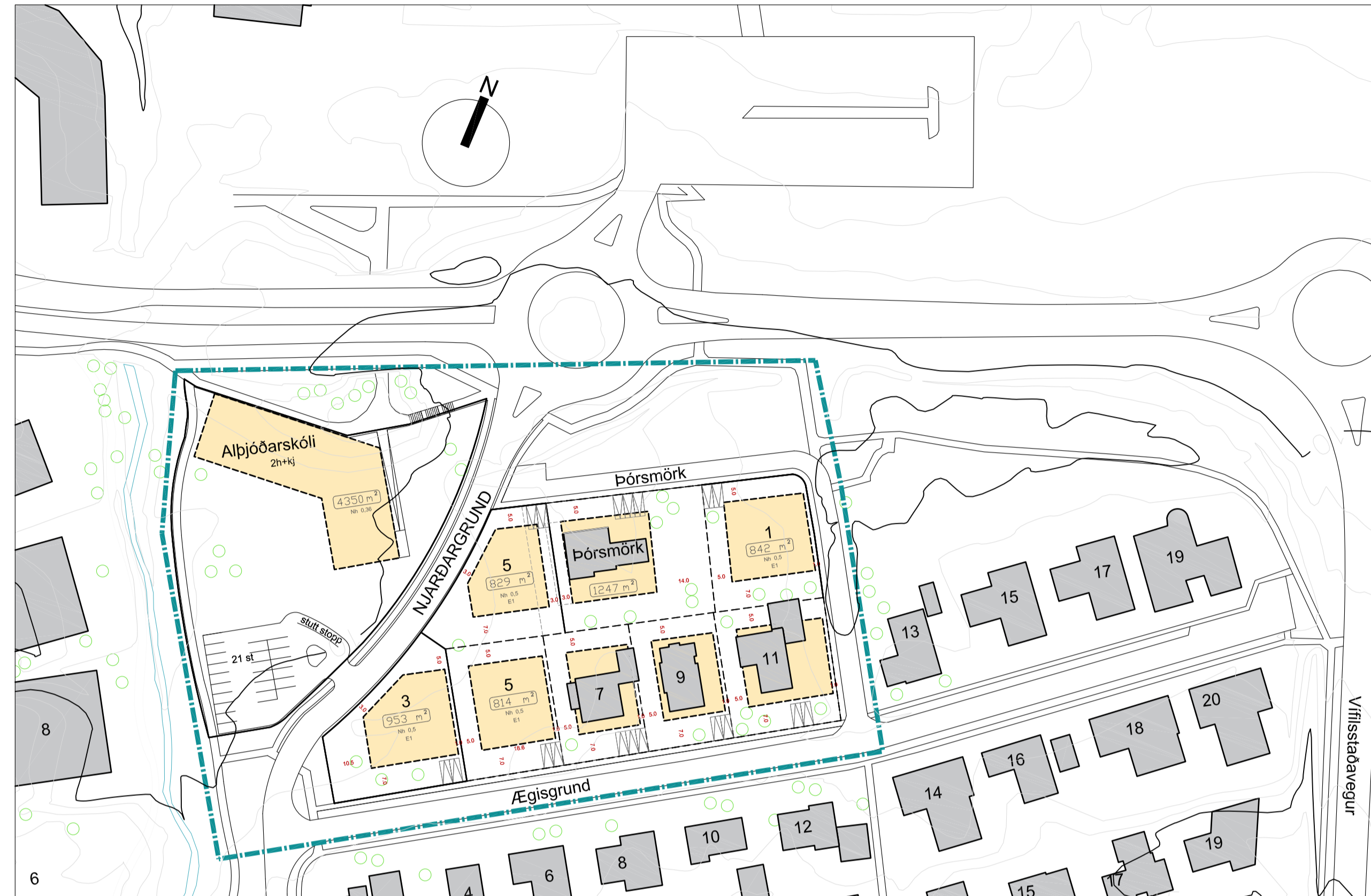
DEILISKIPULAG EFTIR BREYTINGU MKV. 1:1000