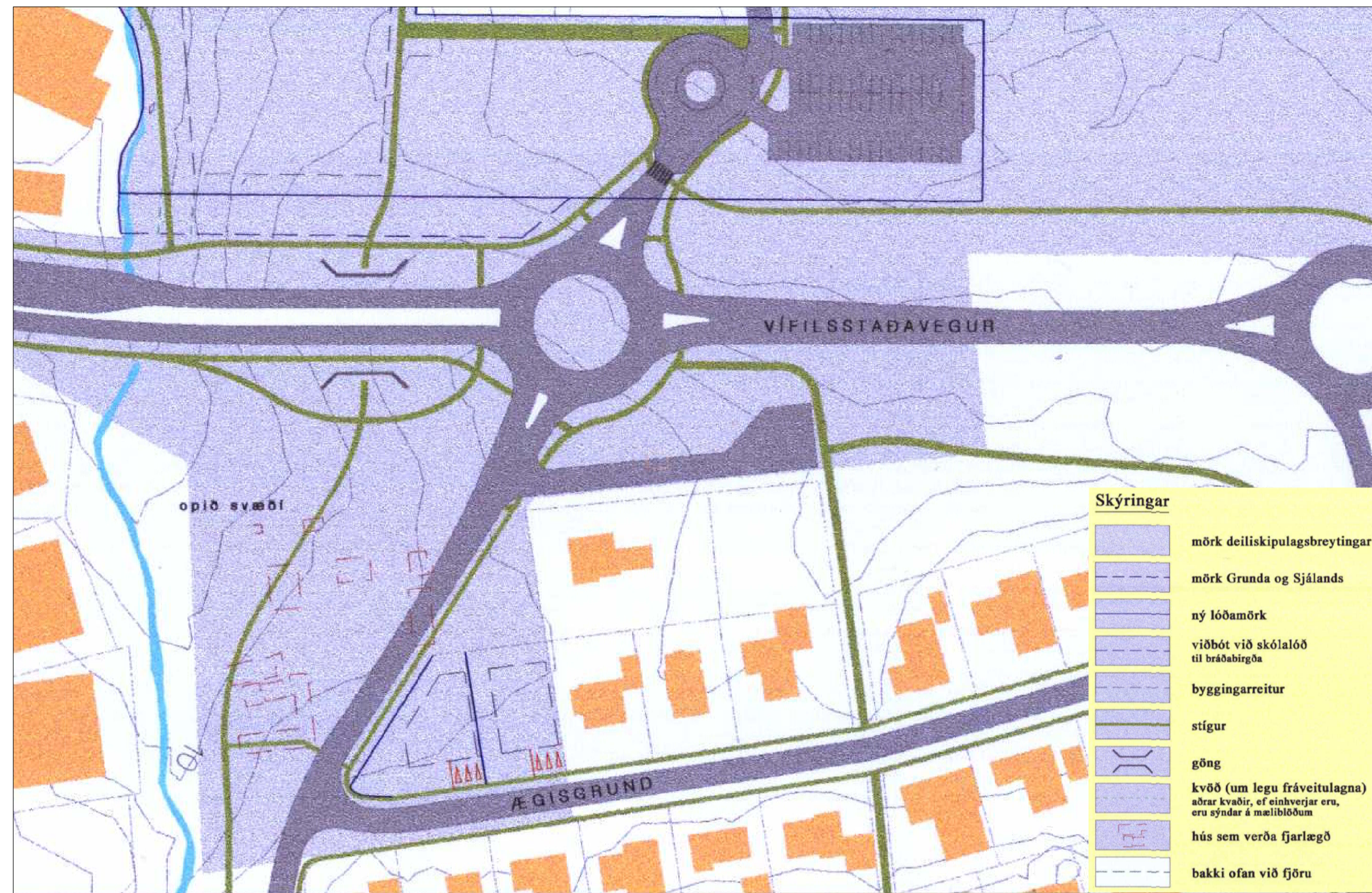
GILDANDI DEILISKIPULAG, SAMÞYKKT 01.04.2004 / AUGLÝST Í B-DEILD STJÓRNARTÍÐINDA 14.04.2004 MKV. 1:1000