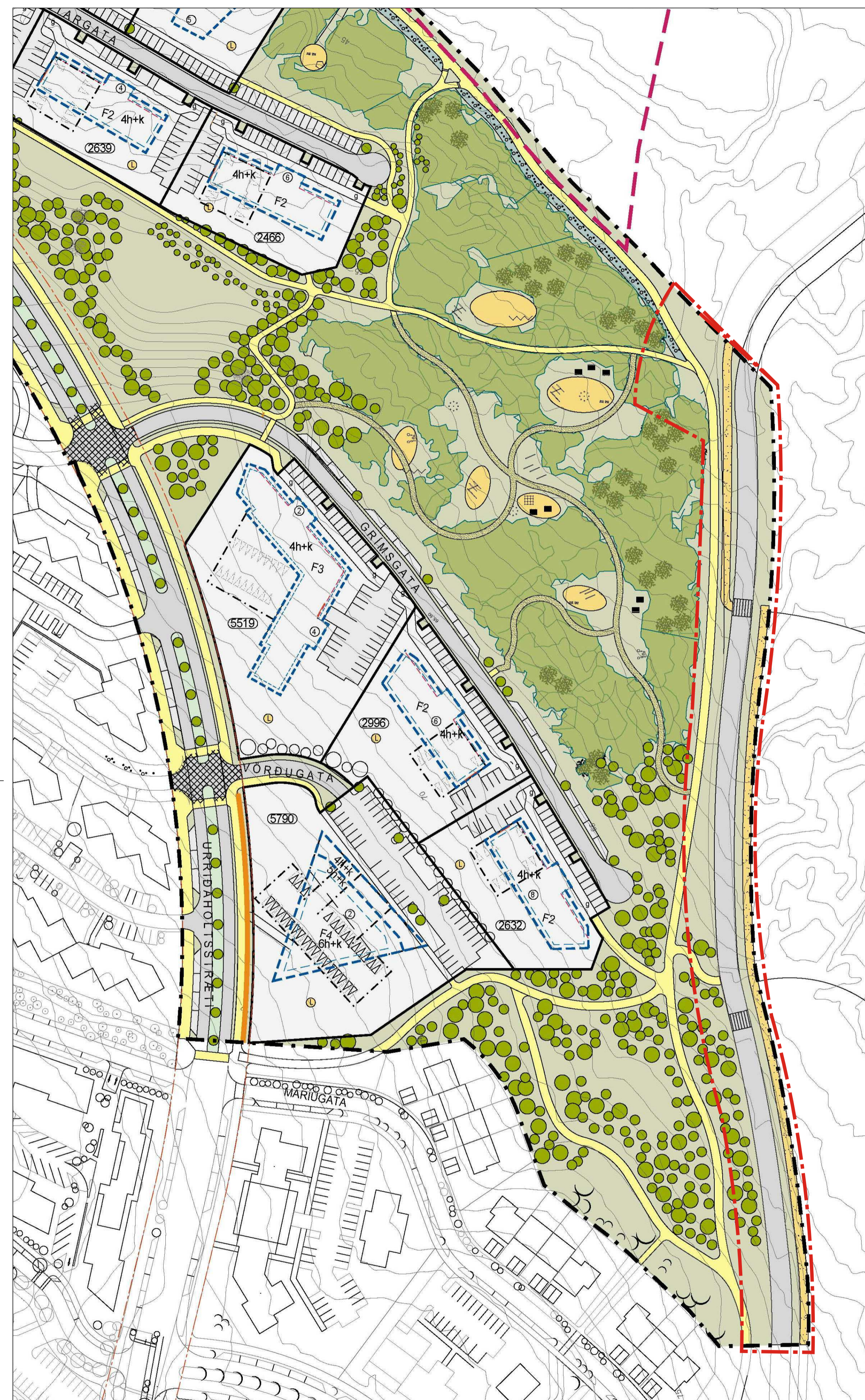
Gildandi deiliskipulag samþykkt í bæjarstjórn 18.03.2021 með síðari breytingum mkv. 1:1000