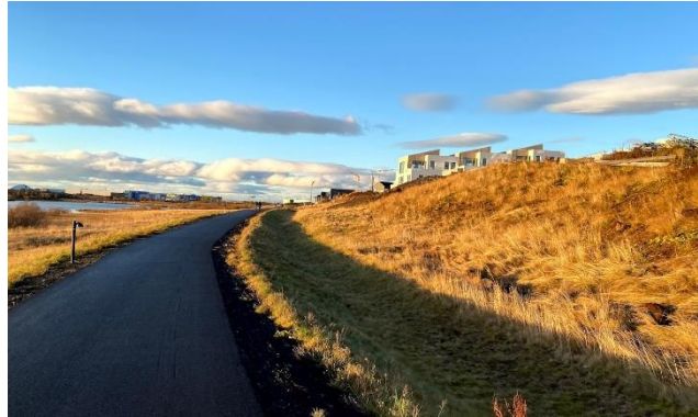
Mynd 1: Fjölbreytt stígaumhverfi Garðabæjar.