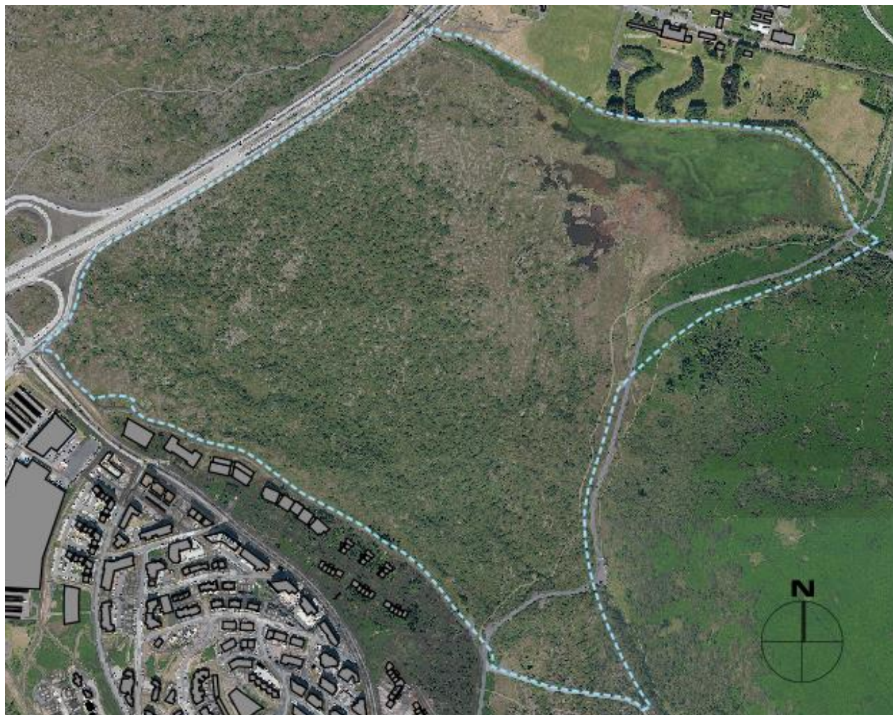
Mynd 1 Afmörkun skipulagssvæðisins

Gróðurfar einkennist af birkikjarri á stærstum hluta hraunsins og í kringum Maríuhella. Sunnan við Vífilsstaðalæk er lynghraunavist og snarrótarvist ríkjandi. Alaskalúpína er við hluta af Elliðavatnsvegi.