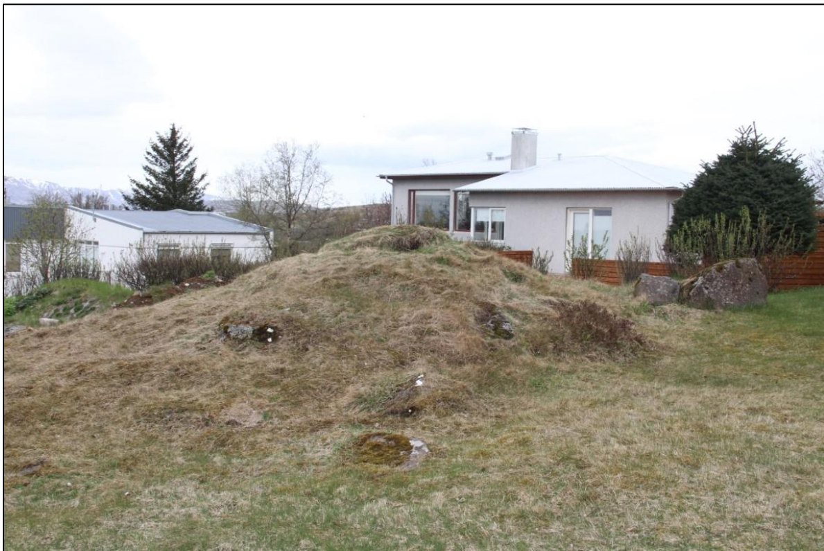
Mynd 7 Guðnýjarstapi horft í austur að Holtsbúð 87.

Rétt vestan við lóðamörk Hofslund 6 má greina þústir sem virðast vera innan túngarðs [1425]. Hún er rúmir 5 metra á lengd og 2,8 á breidd. Þetta eru mjög ógreinilegar minjar en virðast sjást á loftmynd. Ekki var hægt að mæla neina tóft á vettvangi og var því bara mælt ca. ummál á þústinni. Ekki er til neinar heimildir um minjar þarna en í ljósi þess að Hofstaðir eru forn jörð er mikilvægt að raska ekki þessu svæði nema að undangenginni fornleifarannsókn.