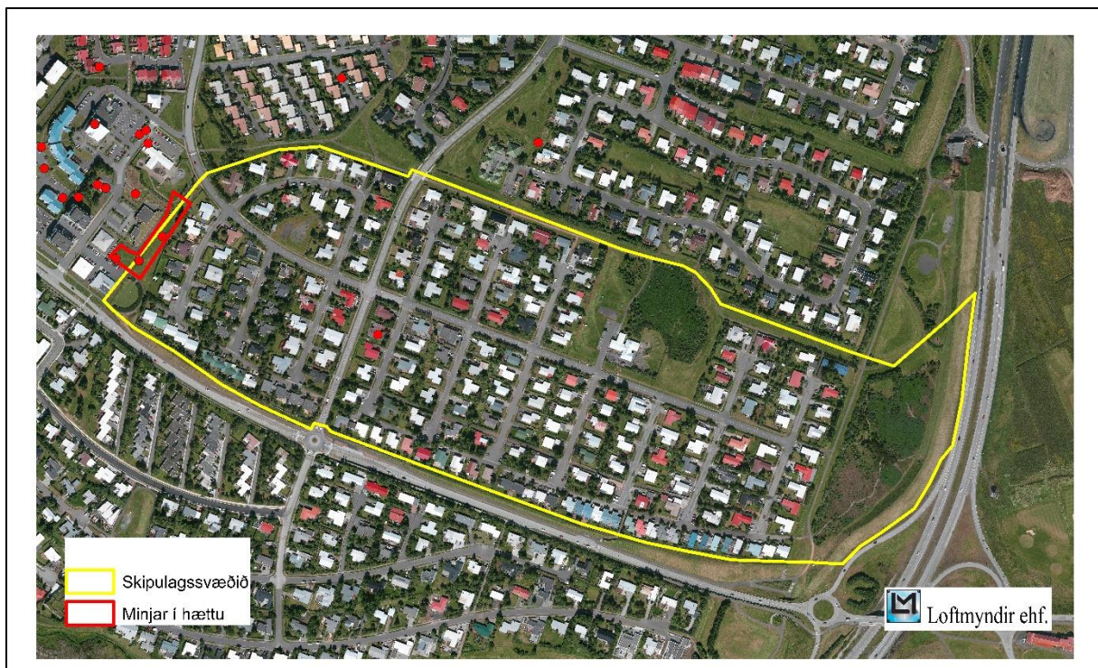
Mynd 1 Deiliskipulagið er gula svæðið og minjar sem eru í hættu er rauða svæðið.

Fornleifaskráning hefur áður farið fram á hluta af þessu svæði vegna aðalskipulags Garðabæjar en þá skráningu vann Fornleifastofnun Íslands ses. Og kom sú skýrsla út árið 2009. Í henni er að finna skráningu á Hofsstöðum en þó ekki tæmandi. 1 Frá því sú skráning fór fram hafa staðlar Minjastofnunar Íslands breyst hvað varðar fornleifaskráningu og ber nú meðal annars að mæla upp allar minjar. Er það nú gert í þessari skráningu.