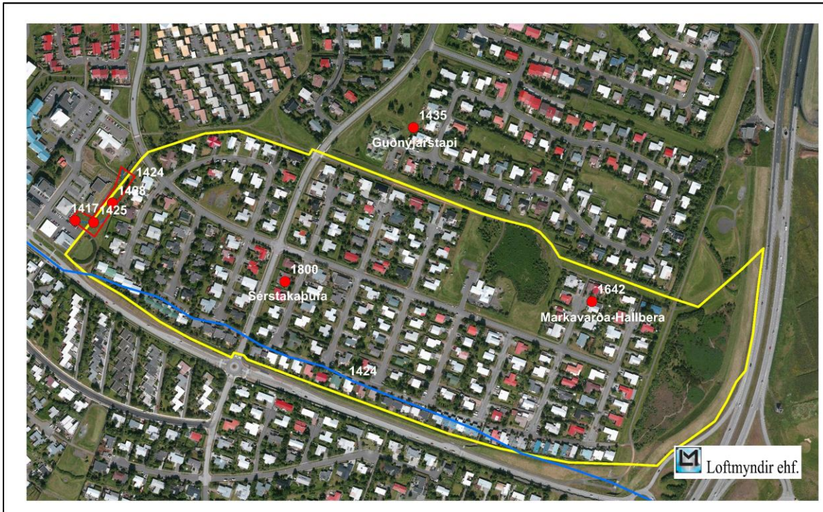
Mynd 4 Yfirlitskort af fornleifum á svæðinu.