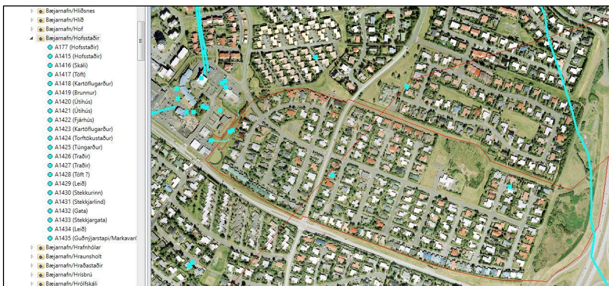
Mynd 2 Skjástot af landfræðilega skráningargrunninum fyrir fornleifaskráningu í Garðabæ.