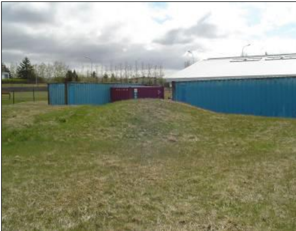
Mynd 6 Hóll [1417] sem er fast upp við túngarð [1425].

Niðurstaðan er því að þarna sé um ræða túngarða frá fleiri tímasteiðum, elsti garðurinn hlaðinn úr torfi en síðar meir torf og grjót. Það er mikilvægt að elsti garðurinn sé kannaður enn frekar og tóft [1417] ef til stendur að nýta svæðið eitthvað.