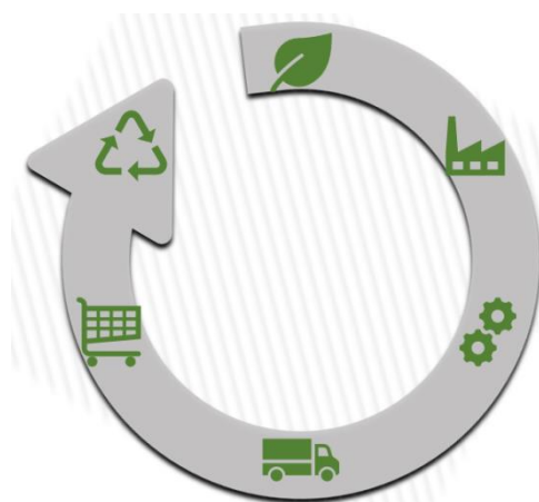
Mynd 2. Lífsferill vöru samanstendur af nýtingu auðlinda, efnisvinnslu, framleiðslu, flutningi, notkun og endurvinnslu auðlinda.

* Gera má umhverfisskilmála við birgja um að vörur þurfi að vera umhverfissvottaðar og úr staðbundinni framleiðslu, þegar hægt er, og að birgjar þurfi að taka tilbaka einnota plastumbúðir til endurnotkunar. Einnig má gera kröfur til verktaka um að þeir noti efni sem er umhverfissvottað, þegar hægt er og að þeir flokki byggingarúrgang í samræmi við kröfur Garðabajar.